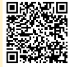
アジアパラ競技大会 公式チケットインフォメーション

※ 二次元コードからアクセスできる Web サイトで応援 ID を登録すると、競技大会の日程などを確認できます。