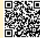
アジア競技大会 公式チケットインフォメーション